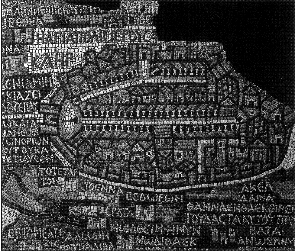
FIGURA 3. Mosaico de la Iglesia de San Jorge, en Madaba, con un plano de Jerusalén en época de Egeria.

Aquel trajín de viajeros a Oriente, a Constantinopla y a los Santos Lugares ¿fue bueno o malo? Puede parecer una pregunta estúpida, por simplista, y porque el mero hecho de moverse para ampliar el conocimiento debería ser saldo positivo. Pero hay algo que matizar. No a todos aquellos curiosos que se echaban a los caminos les guiaba un impulso aceptable, y no me refiero ahora a los gyrovagui . Sabido es que el cristianismo temprano, y muy especialmente en este siglo IV del que hablamos, es un cristianismo que se está abriendo paso, esforzado, a veces hasta combativo, y fuertemente escorado hacia una componente ascética de la vida religiosa. Es precisamente es ese siglo cuando cuajan los tanteos de ascetismo en un embrión sólido de vida monacal.